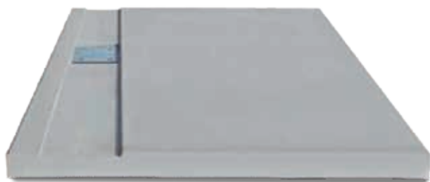
gootplaat type A - boordsteen